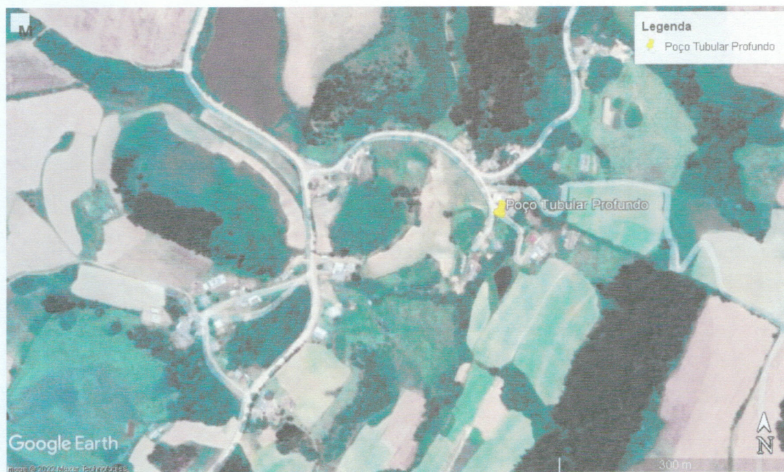
Fig. 1: Localização da área onde deverá ser realizada a perfuração do poço tubular

Considerando-se a avaliação técnica realizada a campo, identificou-se que a perfuração do poço tubular será realizada em rochas vulcânicas (basaltos) da Formação Serra Geral, constituindo uma captação em aquífero fraturado, cujo armazenamento e circulação das águas ocorre por meio de estruturas geológicas, tais como fraturas, falhas, juntas e dilatações existentes nas rochas.